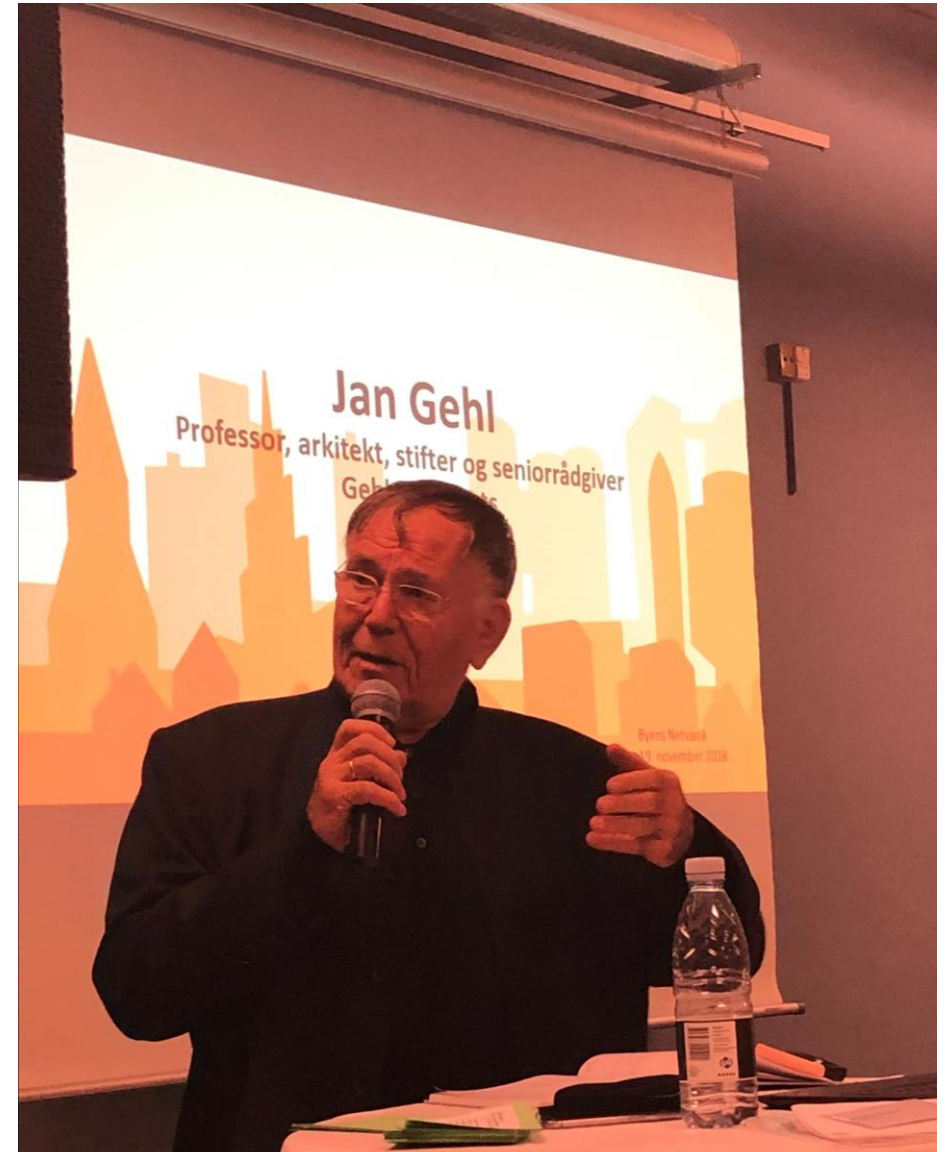
Arkitekt Jan Gehl udfordrede tankesættet bag de moderne byudviklingsprojekter i Nordhavn og Ørestad og opfordrede til at tænke byen nedefra og i øjenhøjde.